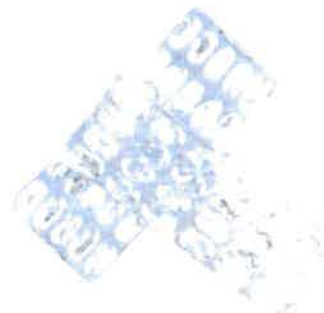
Plaquette de médicament

Vous pouvez déposer vos objets en aluminium dans le bac situé :