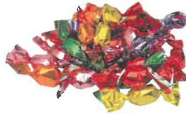
Emballage de bonbon